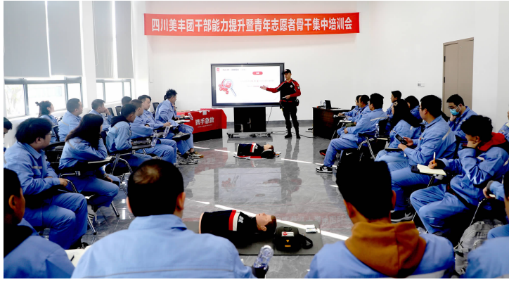
开展院前急救技能培训

11月16日,四川美丰2023年团干部能力提升暨青年志愿者集中培训在高分子公司举办,着力提升公司团干、志愿者综合能力,增强共青团组织力、引领力。培训中,40余名团干部、青年志愿者参观高分子材料产业园,系统学习应急救援、新闻写作、视频制作相关知识,进一步提高院前急救能力、宣传报道水平,为公司高质量发展贡献青春力量和智慧。