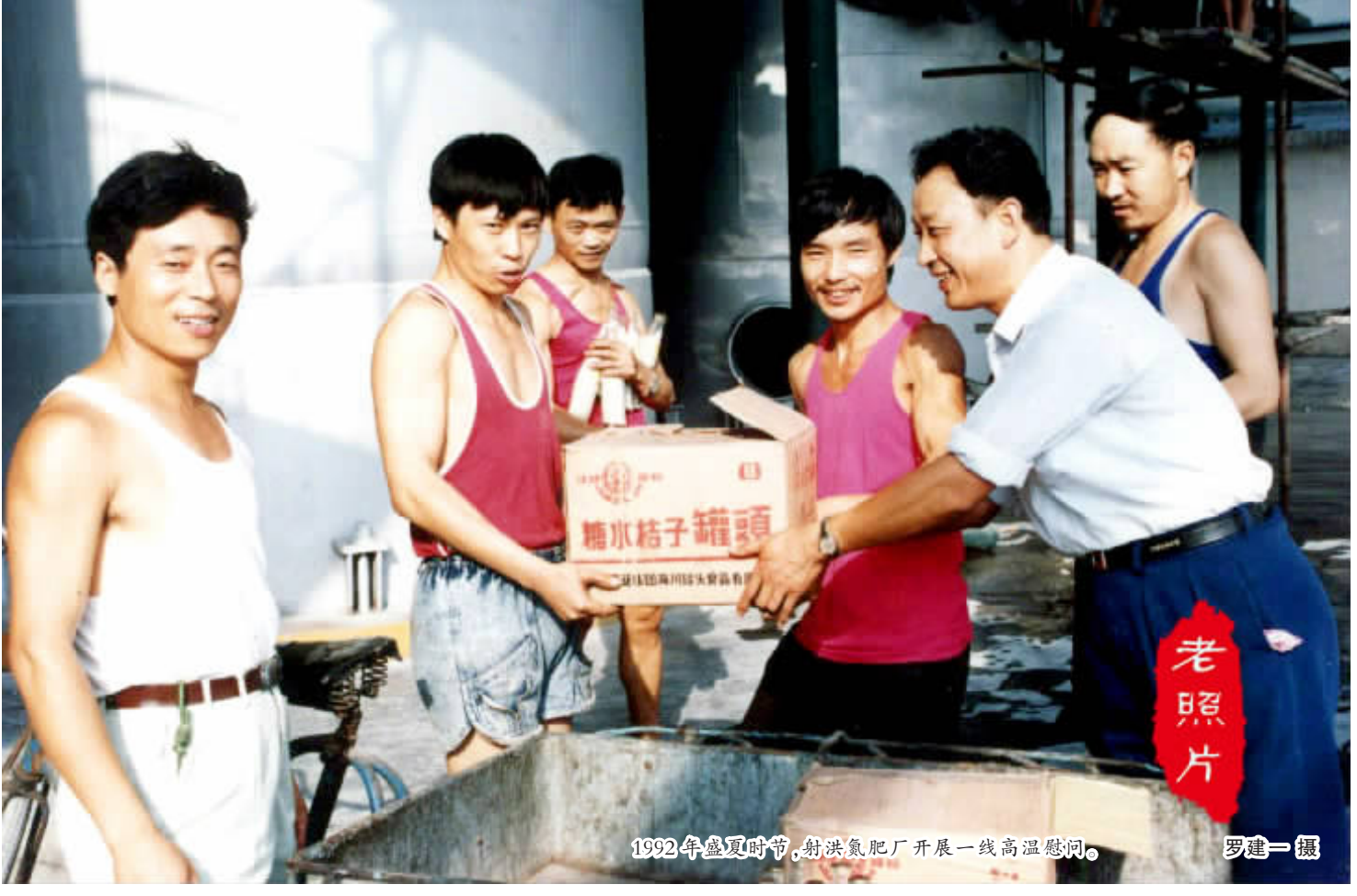
1992年盛夏时节,射洪氮肥厂开展一线高温慰问。

今年是《四川美丰》报创刊二十周年,它正值青年,它胸怀壮志,它身担重任。它是美丰宣贯经营管理方针的喉舌,是建设美丰企业文化的重要阵地,同样也是美丰人抒发胸臆的田园。我想真诚地向她说声感谢,《四川美丰》报敲开了我写作征途的大门,给了我奋发的目标和勇气。我将不断吸收学习,持手中之笔书写更多优秀的文章,与《美丰报》携手共进,共同建设属于美丰的记忆史册。